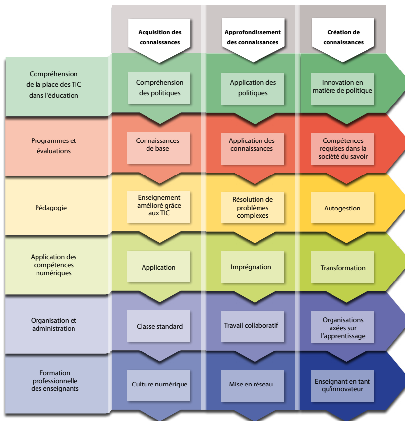
Figure 1. Domaines et niveaux de compétences TIC du Référentiel UNESCO pour les enseignants (2018)

Le programme d'apprentissage à distance et de formation des enseignants couvrait pour sa part les modules suivants : i) approches d'enseignement numérique dans les PEID de la région des Caraïbes ; ii) principes fondamentaux associés à la création de supports pédagogiques numériques ; iii) utilisation de salles de classe virtuelles ; iv) bonnes pratiques liées à la communication numérique, à l'accompagnement à distance des apprenants, et à la création de communautés de pratique.